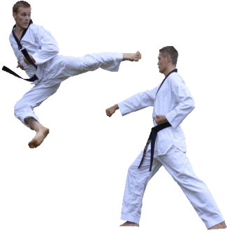
atlo kdwenoi .....

Foglio di lavoro per correggere lettere confuse per parole di Gli Sport Da Combattimento italiano