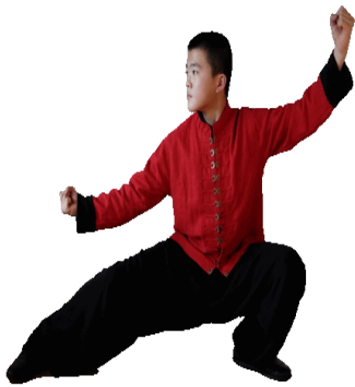
atl ócihi .....