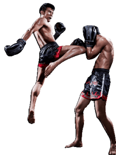
ocl poli .....