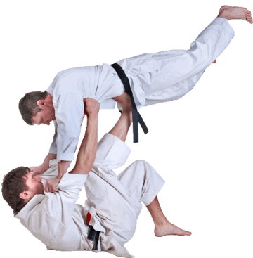
rpean ioeozl .....