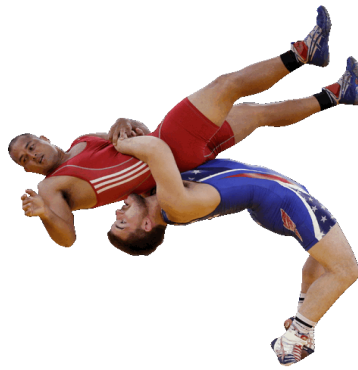
la lotta greco-romana