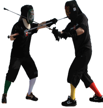
csa aabilol .....